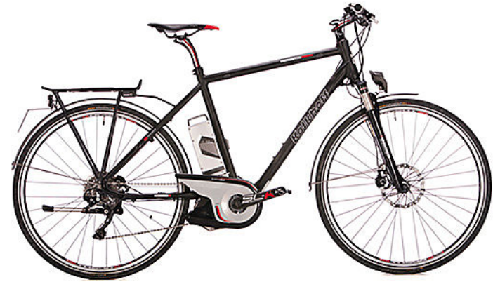
Kalkhoff Pro Connect S