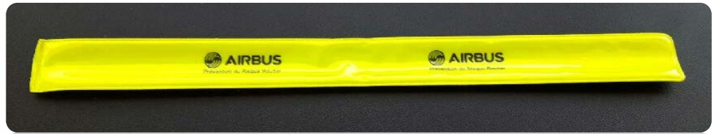
Brassards souples et rigides